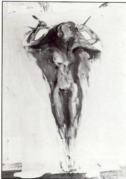
BILDNISSE Auf den Leib gemalt 1977-1979